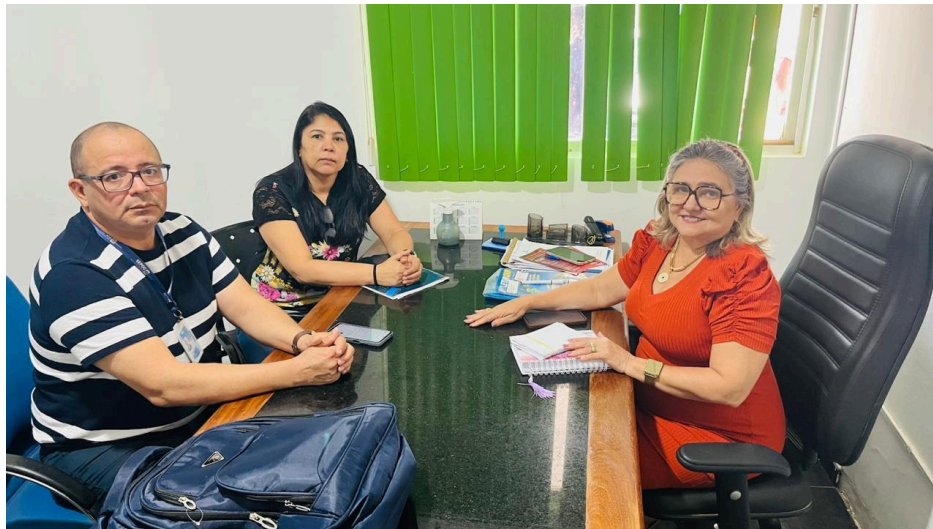
Candeias do Jamari

3.2 Região II - Ariquemes, Alto Paraíso, Buritiz, Cacaúlândia, Campo Novo de Rondônia, Cujubim, Monte Negro e Rio Crespo;