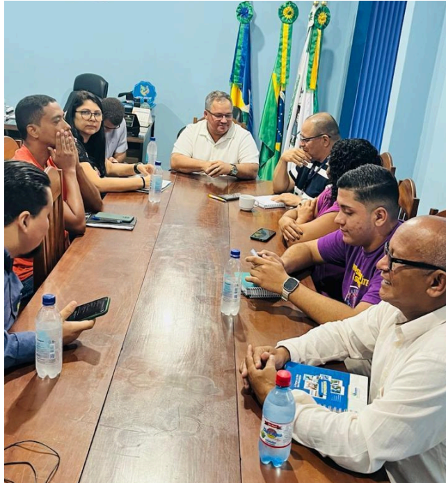
Itapuã do Oeste