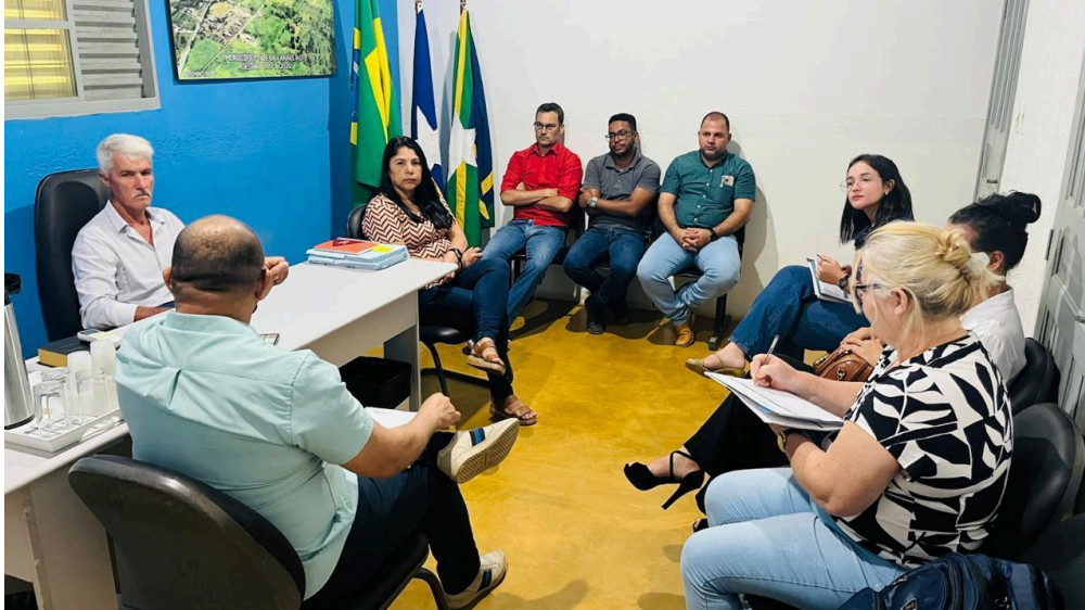
Vale do Anari

indicou o Secretário de Planejamento como o representante do município no grupo de governança.